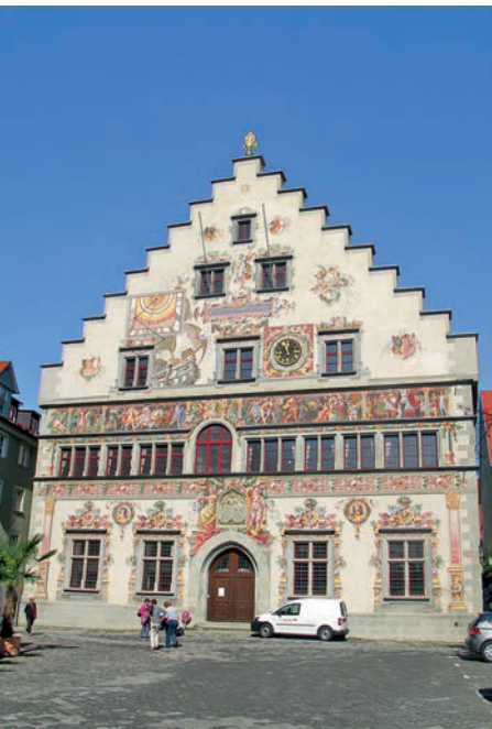
Am Alten Rathaus erzählen Bilder die Stadtgeschichte

Die von repräsentativen Bürgerhäusern mit Laubengängen und Erkern gesäumte Maximilianstraße ist die zentrale Ost-West-Achse der Stadt und ihre beliebteste Einkaufsmeile. Auf der Nordseite schräg gegenüber dem Neuen Rathaus imponieren die Häuser Zur