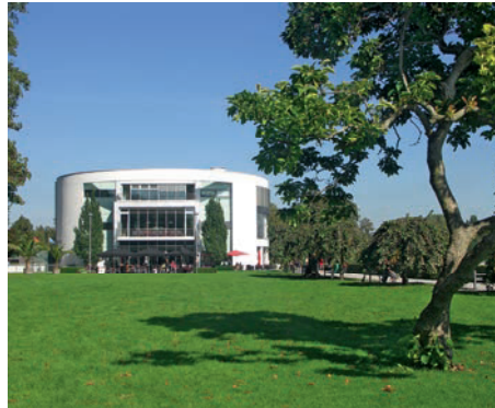
Casino Lindau, Treff für Glückssritter, Spielsüchtige und Geldwäscher

■ Mitte April bis Mitte Okt. Di–Sa 10–17 Uhr, So 14–17 Uhr. Eintritt 3 €. Lindenhofweg 25, Bad Schachen, www.friedens-raeume.de .