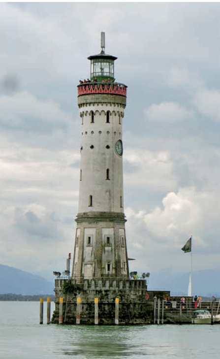
Deutschlands südlichster Leuchtturm

Als erste bayerische Stadt hatte Lindau in den 30er-Jahren des vergangenen Jahrhunderts einen nationalsozialistischen Oberbürgermeister, als eine der letzten Städte Deutschlands wurde es am 30. April 1945 von den Nationalsozialisten befreit und als Korridor zwischen den französischen Besatzungszonen in Deutschland und Österreich (Vorarlberg, Tirol) den Franzosen zugeschlagen. Die erst 1955 aufgehobene Sonderstellung als französisches Bayern gab Lindau gleichsam den Rang eines Bundeslandes und damit die Verfügung über Zölle und Verbrauchssteuern – eine Insel des Wohlstands im ausgebluteten, hungernden und frierenden Nachkriegsdeutschland.