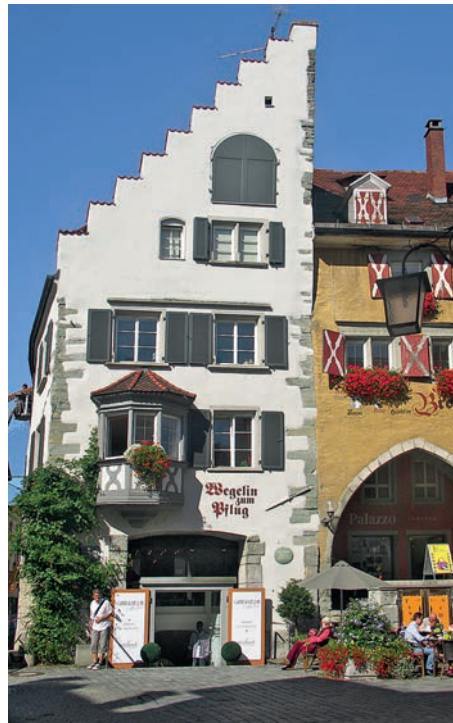
Irgendwie schräg (Maximilianstraße)

Die Gasse In der Grub ist die älteste Verbindung zwischen der früheren Fi- schersiedlung um den Schrannenplatz und dem Stift im Osten der Insel. Schon fast am Markt unterbricht die Stadt- fuge als Neubau die historische