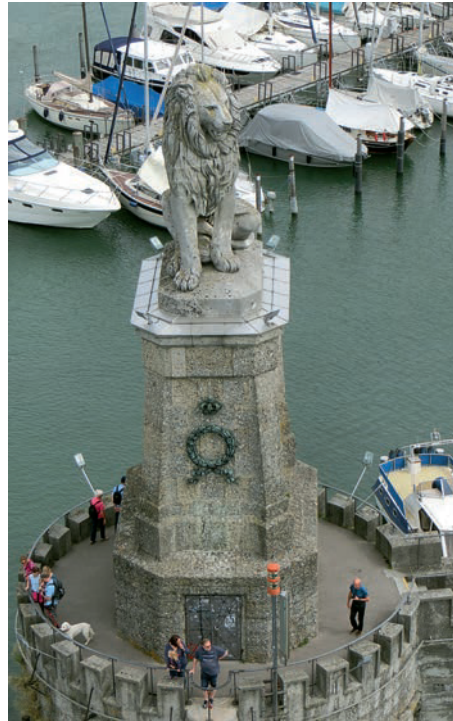
Der Lindauer Löwe

Der Reichsplatz war früher Lindaus Fischmarkt. Auf dem 1884 anlässlich