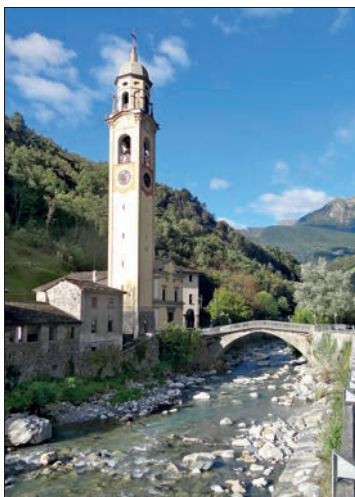
Prosto di Piuo liegt malerisch an der Mera