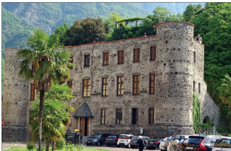
Imposanter Blickfang: das Castello Balbiani

Museo Mulino di Bottonera: Ein rares Beispiel vergangener Industriearchitektur lässt sich im ehemaligen Handwerkerviertel von Chiavenna erleben. Auf vier Stockwerken wird dort am Ufer der Mera die kunstvolle Holzkonstruktion einer Mühle aus dem 19. Jh. präsentiert. Sie war 60 Jahre lang Tag und Nacht in Betrieb und mahlte in dieser Zeit unermüdlich Mehl für die Teigwarenfabrik Moro, die Arbeiter waren in drei Schichten rund um die Uhr eingeteilt. Alle vier Mahlanlagen sind fast vollständig erhalten geblieben, und beim Rundgang kann man die verschiedenen Arbeitsgänge verfolgen: Mahlen, Säuberung, Siebung, Wiegen etc. Von der Wasserkraft der Mera profitierten damals auch eine Papierfabrik, ein Hammerwerk und mehrere Brauereien, bis Ende der 1940er-Jahre schließlich ein Wasserkraftwerk gebaut wurde. Die Fabrik Moro gibt es noch, mittlerweile in fünfter Generation.