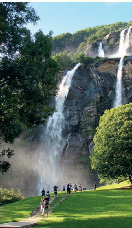
Cascata dell'Acquafraggia: hinter den Häusern von Borgonuovo

■ Mai bis Okt. Do–Di Führungen um 10, 11, 14.30, 15.30 u. 16.30 Uhr, Mi geschl. (außer Feiertage). Eintritt 8 €, Schül./Stud. 6 €. ☎ 0343-37485.