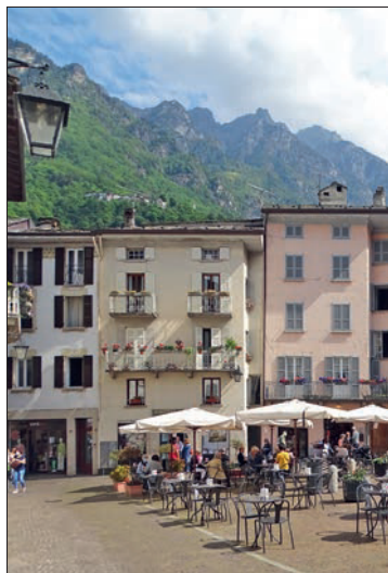
Gemütliche Piazza in Chiavenna

Al Vicolo 3 , etwas versteckt gelegene Trattoria, auch gerne von Einheimischen besucht, lokale Küche, z. B. Hirschcarpaccio , sciatt und polenta taragna aus Buchweizen. Mi geschl. Vicolo dei Pilastrì 7, ☎ 0343-35230.