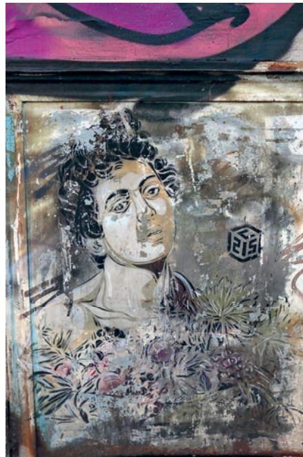
Caravaggio in San Lorenzo

In das traditionelle Arbeiterviertel San Lorenzo , östlich des Bahnhofs zwischen Universität, Hauptfriedhof und Stadtautobahn ( Tangenziale Est ) gelegen, dringen nicht allzu viele Touristen vor. Es ist wie ein Schachbrett ange-