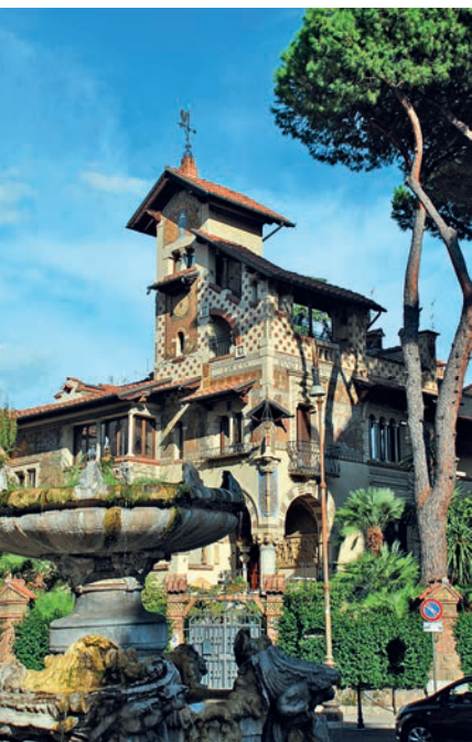
Die Feenvilla im Quartiere Coppedè

Ein ganzes Viertel ist das Gebiet zwischen Via Tagliamento und Piazza Trasmiseno zumindest größtmäßig vielleicht nicht, doch wenn man durch den Torbogen der Via Dora das Coppedè-Viertel betritt, wähnt man sich erstmal in einer anderen Welt: Geradezu märchenhaft nimmt sich die zentrale Piazza Mincio mit ihrer Fontana delle Rane , dem „Froschbrunnen“, aus, drumherum die Villen und Häuser mit ihrem oft asymmetrischen Stilmix aus überwiegend Jugendstil (italienisch: „ Stile Liberty “), aber auch Gotik, maurischen Elementen, Barock – und vielem, das man irgendwie nicht zuordnen kann. Prachtbeispiel dieser fantasiereichen Architektur ist die Feenvilla ( Villino delle Fate ) am Eck der Piazza Mincio zur Via Brenta , die alle architektonischen Eigenheiten dieses einmaligen Viertels zu vereinen scheint. Geschaffen wurde es in den Jahren 1913 bis 1926 durch den Architekten Gino Coppedè (1866–1927), der hier im Auftrag einer ligurischen Baufirma auf 31.000 Quadratmetern