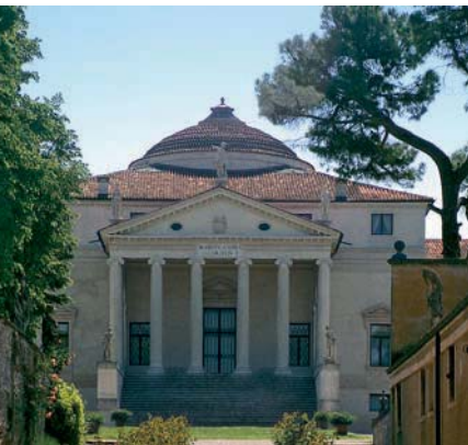
Die Villa Rotonda gehört zu den markantesten Villen Palladios

■ März bis Okt. tägl. 10–18, sonst 10–16 Uhr. Eintritt ca. 10 €, 12–18 J. und Studenten 7 €. ☎ 0444-321803, www.villavalmarana.com.