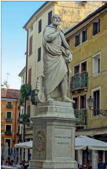
Maestro Palladio steht mit Denkerstirn neben der Basilica

Ein ganzes Stück weiter die Straße hinunter trifft man auf die eindrucksvoll rot-weiß gemauerte Kirche Santa Croce detta dei Carmini mit hübschem blauem Sternhimmel und filigranen Seitenaltären. Die Straße endet kurz darauf beim mittelalterlichen Stadttor Porta Santa Croce .