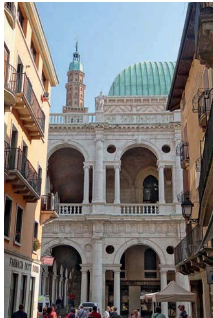
Zwischen kleinen Gässchen öffnet sich der Blick auf die Basilica

■ Corte dei Bissari , Mitte April bis Ende Sept. Di u. Do 10–12, Sa/So 10–12, 14–15 Uhr, nur