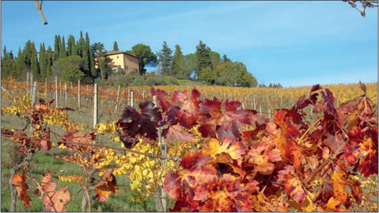
Weinberg im November

Nach 400 m (insgesamt 1 km von unserem Start an der Piazza Bucciarelli) biegen wir bei der Cappella delle Grazie 2 links ab auf den Schotterweg (Beschilderung „Santa Lucia di Sopra“) nach Westen. Bereits hier öffnet sich ein schöner Blick auf die Hügel des Chianti-Gebiets.