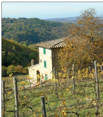
Landhaus zwischen den Rebstöcken

Für die Fortsetzung der Wanderung orientieren wir uns auf der Piazza vor dem Restaurant am Hinweisschild in Richtung Lamole di Lamole und schlagen diesen asphaltierten Weg ein. An Oliventerrassen entlang erreichen wir kurz darauf das moderne, gelbe Gebäude einer Weinkellerei. 400 m weiter wird Casale Poggio , eine kleine Häuser-