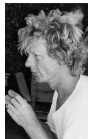
Coole Frisur: Schnappschuss des Jungverlegers im Jahr 1982.

schreiben. Die erste Auflage habe ich in den VW Käfer geladen und auf einer Buchhandelstour durch die ganze BRD kutschert – Kofferraumverkauf sozusagen. Ein Wagnis, das damals „normal“ war.