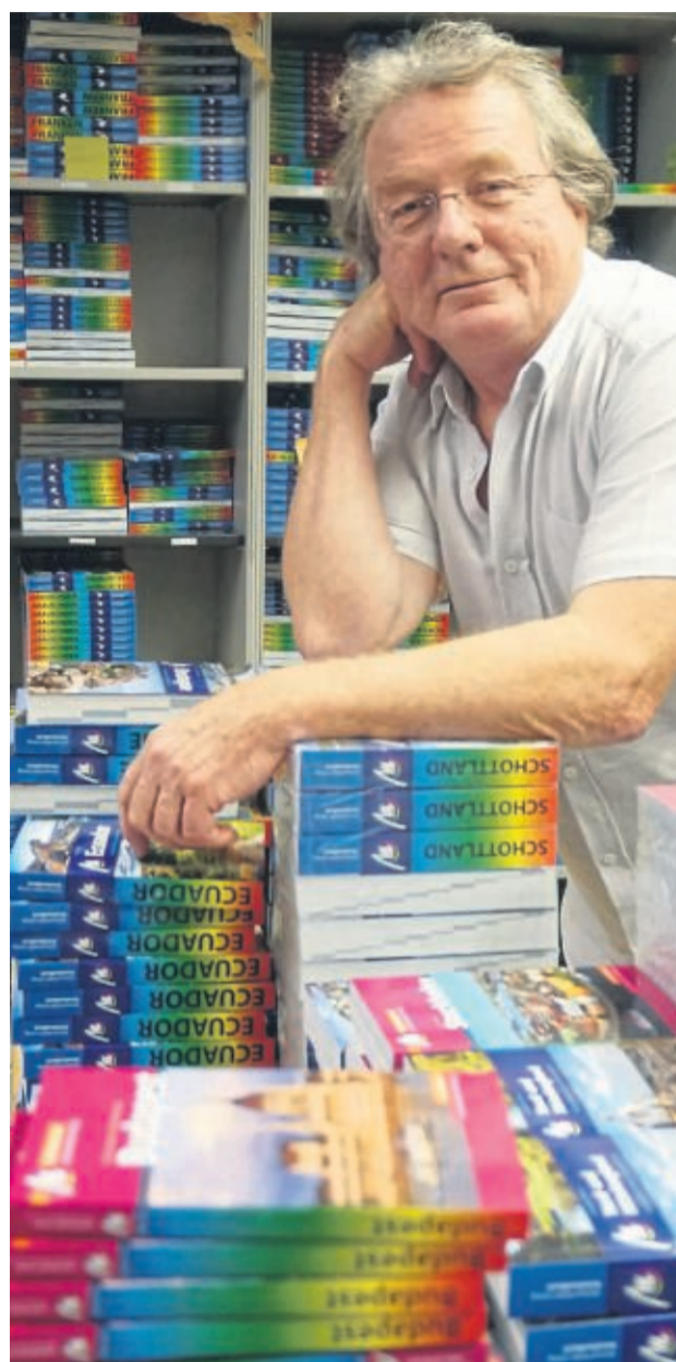
Markenzeichen Regenbogenbuchrücken: Der Verleger in seinem Büro in Erlangen.