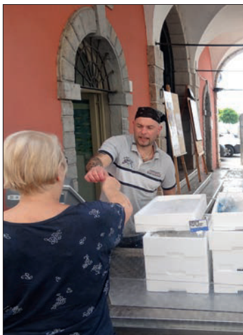
Jeden Vormittag frischer Fisch in der Loggia am Hafen

*** Villa Europa 2 €€, aufmerksam geführter Familienbetrieb direkt an der Gardesana, 100 m vom Strand Fontanelle (Weg führt hinunter). Die Zimmer zur Seeseite sind ruhig, aber auch ein ganzes Stück teurer als zur Stra-