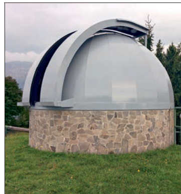
Observatorium in klarer Bergluft

Übernachten/Essen Tavagnù , das rustikale „fienile“ hat ein verspieltes Innenleben mit gemütlichen Sitzcken, draußen gibt es Liegestühle, Spielgeräte und eine Terrasse mit Blick in die waldreichen Berge. Essen kann man Spaghetti, Bruschette und Piatti formaggio. Ganzjährig. ☎ 0365-74067.