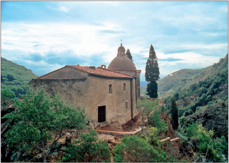
Madonna di Monserrato – die Wallfahrtskirche bei Porto Azzurro