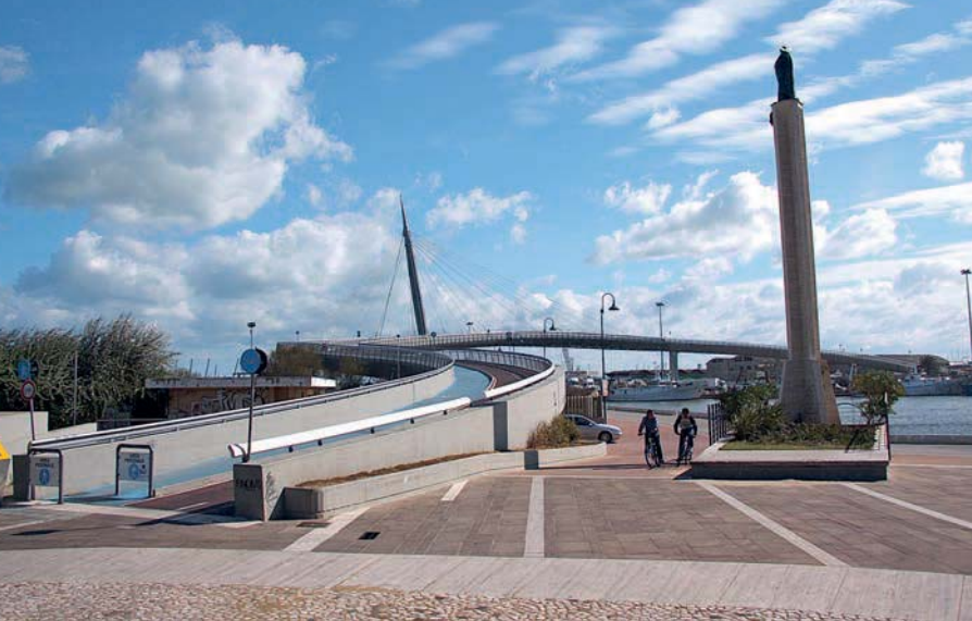
Die Fußgängerbrücke am Hafen von Pescara

Stadtbusse: mit der Linea 21 mindestens halbstündlich vom Corso Vittorio Emanuele nach Francavilla al Mare, mit der Linea 2 ebenfalls halbstündlich nach Montesilvano, die Nr. 8 und 38 fahren alle 20 Minuten zum Flughafen, die Nr. 5 alle 15 Minuten zum Krankenhaus (Ospedale). Tickets (auch für Stadtbusse) beim Zeitungskiosk im Bahnhof, www.gtmpecscara.it .