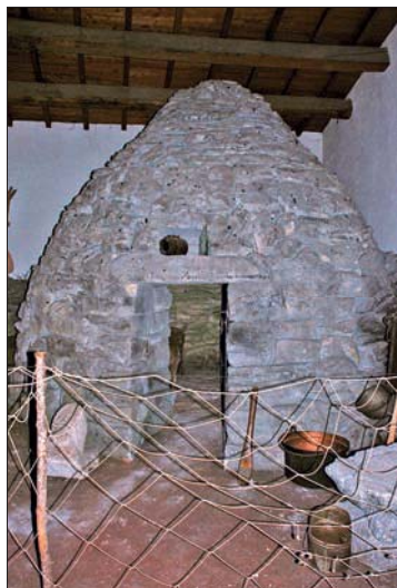
Hirtenbehausung im Museum

Tägl. 9.15–13.15 Uhr sowie Sa (im Sommer auch So) 16.30–19 Uhr geöffnet, im Sommer außerdem auch Sa/So am Abend. Eintritt 6 €, ermäßigt 3 €; Audioguide (auch auf Deutsch) im Preis enthalten. Via delle Caserme 22, ☎ 085-4510026, www.gentidabruzzo.it .