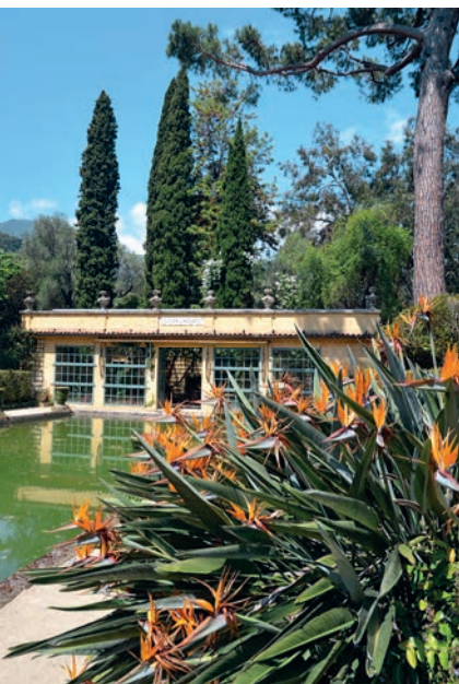
Serre de la Madone

■ 74, route de Gorbio. Tägl. außer Mo 10–18 Uhr, im Winter bis 17 Uhr. Im Nov. geschlossen. Führungen tägl. um 15 Uhr. Eintritt 8 €, erm. 4 €.