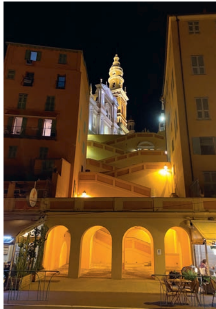
Die Kathedrale von Menton

Im letzten Drittel des 19. Jahrhunderts setzte sich bei englischen Ärzten die Ansicht durch, dass das ausgesprochen milde Klima von Menton nicht nur für Zitronen- und Orangenbäume geeignet sei, sondern auch die unter dem Londoner Nebel leidenden jungen Damen zum „Blühen bringe“. Doch unterschied sich der Tourismus in Menton deutlich von den anderen Metropolen der Côte d'Azur: Da Menton erst 1884 einen Anschluss an das Eisenbahnnetz erhielt, wurde die Stadt relativ spät zu einem Refugium der Reichen, doch