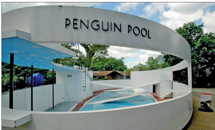
Im London Zoo

Lubetkin , der ein ellipsenförmiges Bassin mit spiralförmigen Rampen entworfen hat, das allerdings für die Haltung der Pinguine wenig geeignet war.