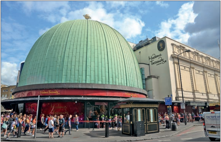
Besuchermagnet: Madame Tussauds

warten dann einige illustre Persönlichkeiten aus der Königsfamilie wie beispielsweise Henry VIII. oder Queen Elizabeth I. Wer will, stellt sich neben Diana und lächelt ihr freundlich zu. Glaubensfeste Katholiken können sich kurz darauf vor dem Papst verbeugen.